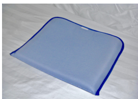
COUSSINS DE CHAISE